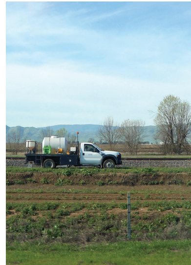
Aplicación de herbicidas en un derecho de vía en el Condado de Glenn.