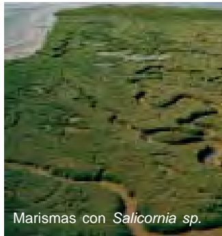
Marismas con Salicornia sp.

Este roedor prefiere las marismas costeras densamente vegetadas con Espárrago de Mar ( Salicornia sp. ). Los prados y pastizales adyacentes a las marismas también son utilizados, pero solamente cuando nuevos brotes de pasto proveen cobertura suficiente. En primavera y verano, algunos ratones realizan incursiones diarias desde el Espárrago de Mar a los pastizales. Esto sólo sucede si hay suficiente vegetación que los proteja de sus depredadores.