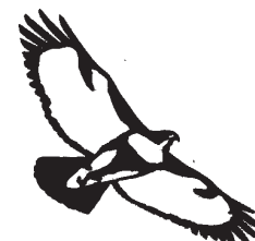
Halcón de Cola Roja

Los nidos duran por varios años, y pueden ser utilizados no sólo por varios pares de halcones de Swainson, sino también por distintas aves rapaces como el halcón cola roja, halcón pecho rojo, y el tecolote cornudo. Cuando los halcones de Swainson llegan de su migración de invierno, a veces encuentran su nido ya ocupado por otras aves rapaces. Esta competencia por los nidos es otro indicador de la limitada cantidad de hábitat de anidación adecuado que hay actualmente.