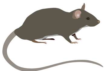
Rata de techo

Coloque las trampas cerca de las paredes, detrás de los objetos y en los rincones oscuros.