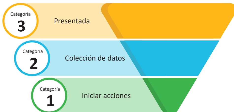
Figura 1. Categorías para prioridades potenciales presentadas de manera externa. Categoría 1 – Iniciar acciones, Categoría 2 – Colección de datos y Categoría 3 – Presentada

Los miembros del SPARC y el público tendrán la oportunidad de presentar prioridades potenciales al departamento. Todas las presentaciones se consideran Categoría 3. El departamento publicará un resumen de la información en nuestro sitio web para todas las prioridades potenciales presentadas incluyendo, entre otras, el/los ingrediente(s) activo(s), el punto final de exposición de interés y la(s) persona(s) u organización(es) que la(s) presentan.