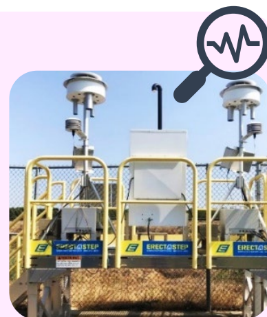
Estación de monitoreo.

Los pesticidas son monitoreados por 24 horas consecutivas una vez a la semana durante todo el año. El DPR reporta la concentración de cada pesticida en 1 día, 4 semanas (13 semanas para 1,3-dicloropropeno y cloropicrina) y 1 año. El DPR establece el nivel de detección (SL) o concentraciones reglamentarias (RT) para cada pesticida para limitar las exposiciones y evitar efectos adversos para la salud. Los SL se utilizan para evaluar los probables efectos en la salud, mientras que las RT se establecen a base de evaluaciones completas de los posibles riesgos para la salud. Exceder las concentraciones de RT sugiere que las restricciones sobre el uso de pesticidas pueden necesitar ser modificadas para mejorar las protecciones para las personas y el medio ambiente.